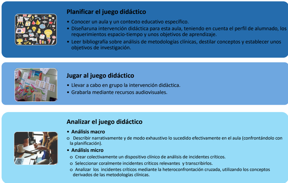
Figura 3. Metodología de análisis clínico de incidentes críticos para la investigación formativa en Educación. Elaboración propia.

Con todo lo expuesto anteriormente, se propone el análisis clínico de incidentes críticos del aula como una metodología de investigación formativa apta para el estudiantado de Educación. El protocolo para llevarlo a cabo se sistematiza del siguiente modo para que sea integrable a proyectos de aprendizaje servicio, prácticums y TFG.