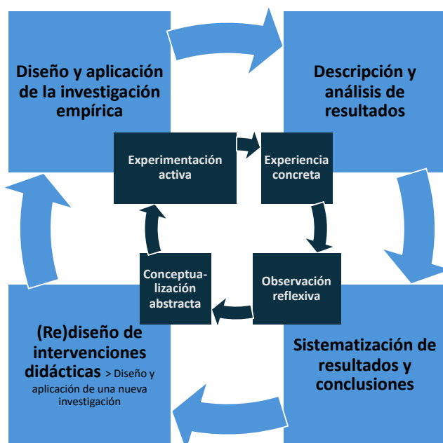
Figura 2. La competencia investigadora en analogía con el ciclo de aprendizaje a partir de la experiencia (Kolb, 1984). Elaboración propia.

La introducción de competencias investigadoras en la formación inicial se ampara en los paradigmas de la investigación-acción participativa (Fals Borda, 1979), con todas sus derivadas actuales, y a menudo se equipara también a los ciclos iterativos de la práctica reflexiva (Schön, 1998; Perrenoud, 2004) o al aprendizaje a partir de la experiencia (Kolb, 1984), puesto que determinados tipos de investigación educativa implican objetivar la propia praxis, revisarla críticamente y extraer conocimiento de ella. Y este conocimiento teórico, a su vez, debe retornar a la práctica y ser reformulado nuevamente, en una dinámica iterativa y reflexiva continuada.